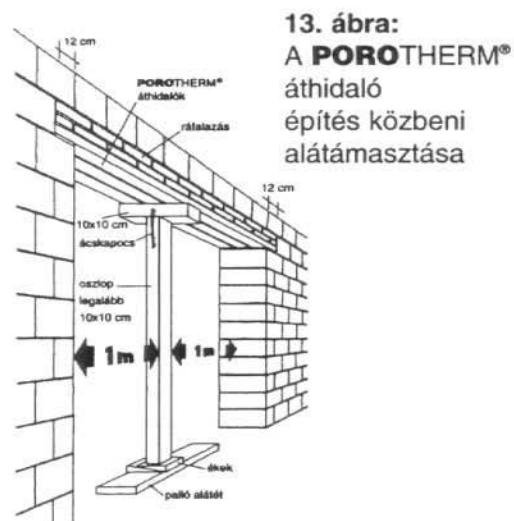
13. ábra: A POROTHERM® áthidaló építés közbeni alátámasztása

Különös gondot kell arra fordítani, hogy a közvetlenül az áthidalók alá kerülő gerenda az egymás mellé helyezett összes áthidalót átfogja és alátámassza.