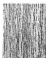
Extra világos tölgy